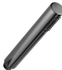
Maneral de Ducha Futura anti-cal