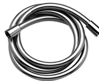
Flexo de ducha PVC 175 cm