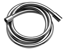
Flexo de ducha PVC 175 cm