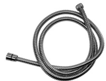
Flexo de ducha latón doble grapado 170 cm